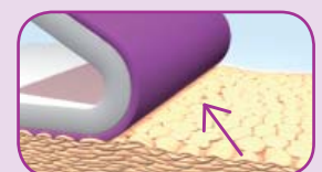
Sin desprendimiento de piel con la Tecnología Safetac