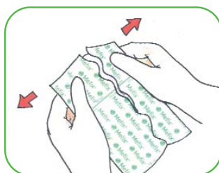
Separar las dos partes del papel protector, estirando suavemente y doblando el Mefix. Quitar la parte estrecha.