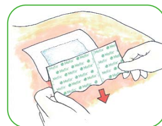
El adhesivo se aplica sobre la piel. Se retira el resto del papel. No estirar cuando esté colocado.