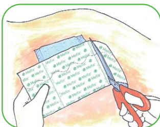
Cortar el tamaño adecuado