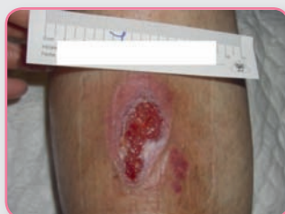
Herida crónica con exudado bajo y piel perilesional delicada

La espuma de poliuretano absorbente y el soporte semi-permeable aseguran un alto drenaje de exudado, protegiendo la piel perilesional contra la maceración.