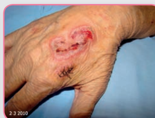
Herida aguda con exudado bajo y piel perilesional delicada