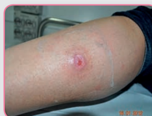
Herida aguda con exudado bajo y piel perilesional sana