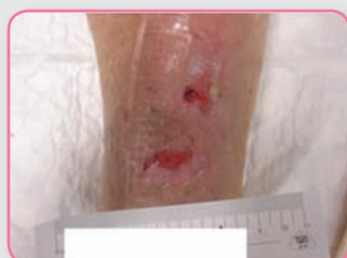
Herida crónica con exudado bajo y piel perilesional sana

La compresa central absorbente y el soporte semipermeable aseguran un alto drenaje de exudado, protegiendo la piel perilesional contra la maceración.